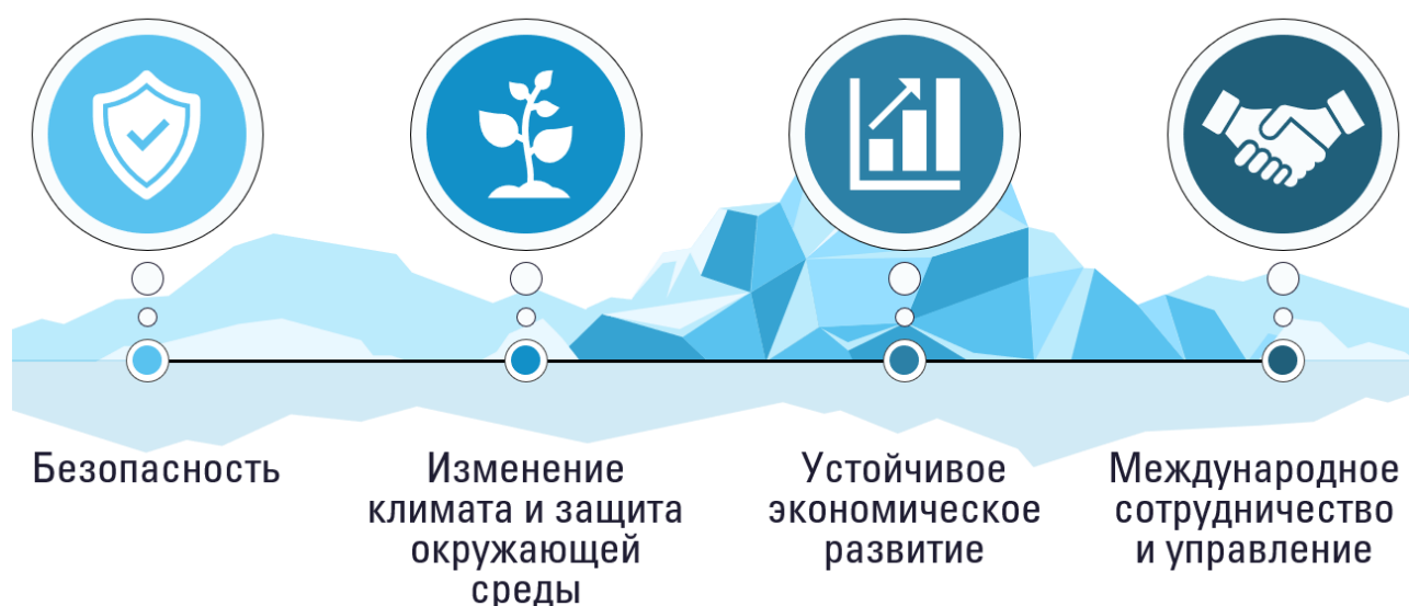
Рисунок 2 – Компоненты Арктической стратегии США

США продвигает свои интересы по четырем взаимодополняющим направлениям (рисунок 2), охватывающим как внутренние, так и международные проблемы [17]. Рассмотрим их более детально.