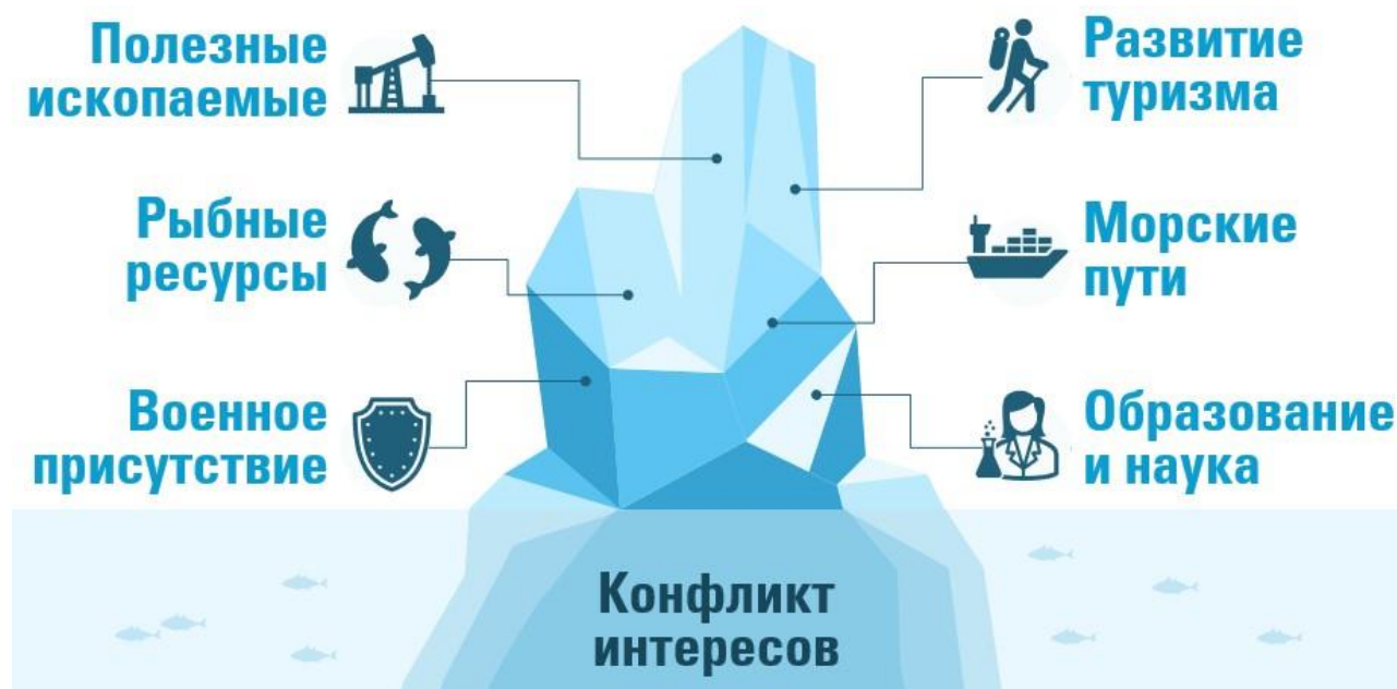
Рисунок 1 – Сферы интересов стран в Арктике