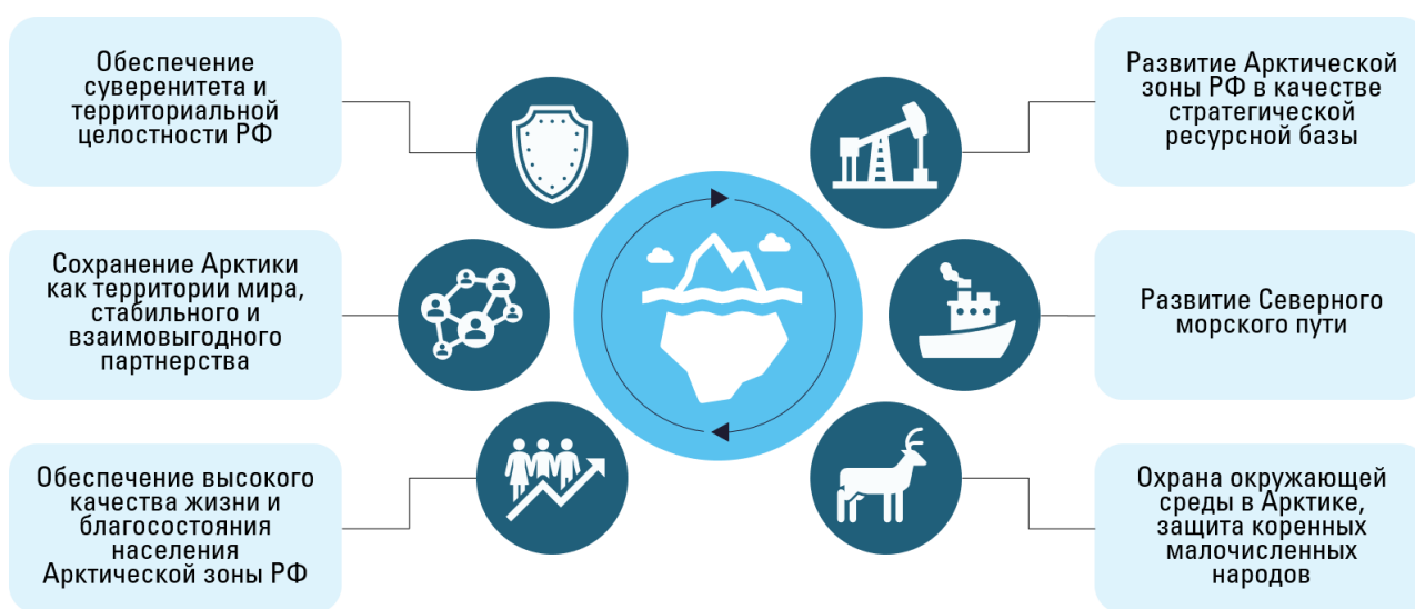
Рисунок 3 – Основные национальные интересы РФ в Арктике

Арктическая стратегия России до 2035 года — это план действий и приоритетов, установленных правительством Российской Федерации для развития арктического региона. Основная цель этой стратегии – обеспечение безопасности и устойчивого развития России в Арктике, включая использование природных ресурсов, создание новых инфраструктур и повышение благосостояния местного населения. Рассмотрим основные национальные интересы Российской Федерации в Арктике (рисунок 3) [2].