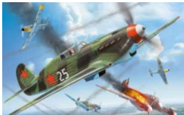
Як-3 Як-7 в бою