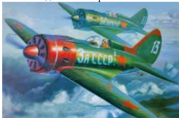
Рисунок 5 – И-16

Бомбардировщик Пе-8, 4-моторный самолет, также известный под именем ТБ-7, весит чуть менее 30 тонн и способен нести до 6 тонн бомб. Максимальная дальность полета машины составляет 3600 километров. Это позволило уже в августе 1941 г. осуществить бомбардировку Берлина.