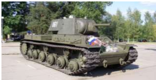
Рисунок 8 – КВ-1, установленный у музея-диорамы «Прорыв блокады Ленинграда» возле Кировска