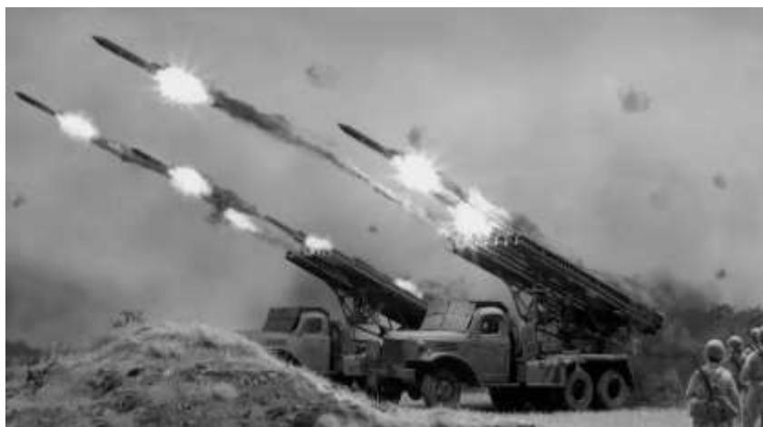
Рисунок 10 – Залп "Катюши"

Нацисты осознали угрозу, исходящую от советских реактивных систем залпового огня, и начали предпринимать все возможное для их уничтожения. Осенью 1941 г., вскоре после первого боевого применения «Катюш» под Оршей, немецкие офицеры начали