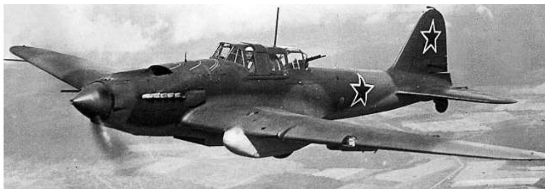
Рисунок 4 – Ил-2.