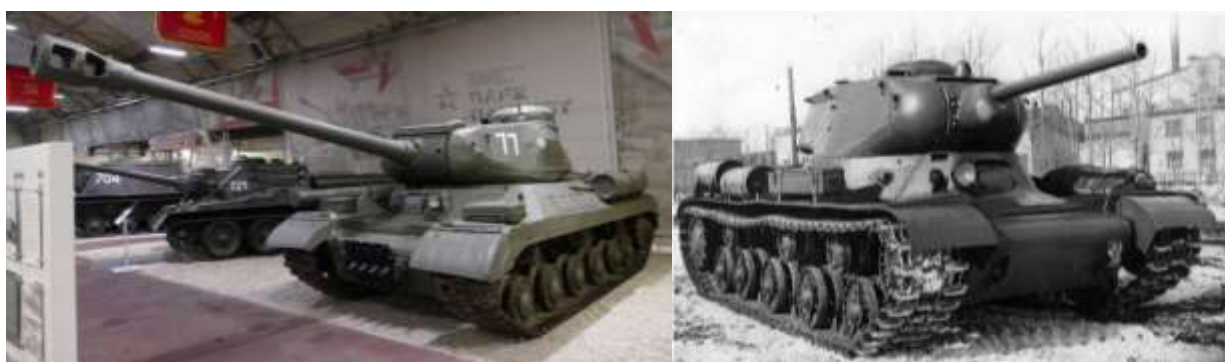
Рисунок 9 – ИС-2М в экспозиции парка «Патриот» и ИС-1 весной 1943 г. на заводском дворе – пятикатковая ходовая часть и трёхместная башня с 76-мм орудием.

Тяжелый танк ИС-2 стал лучшим тяжёлым танком Второй мировой войны. В первую очередь он был очень удачно вооружён: его броня защищала от массированного огня немецких 75-мм пушек KwK 40 и аналогичных PaK 39, хотя после переделки лобовой детали оставалась недостаточной против «Пантеры». Умеренный вес танка, и неплохая подвижность облегчали его транспортировку. Формально ИС-2 состоял на вооружении до 1997 г., когда был окончательно списан (рис. 9).