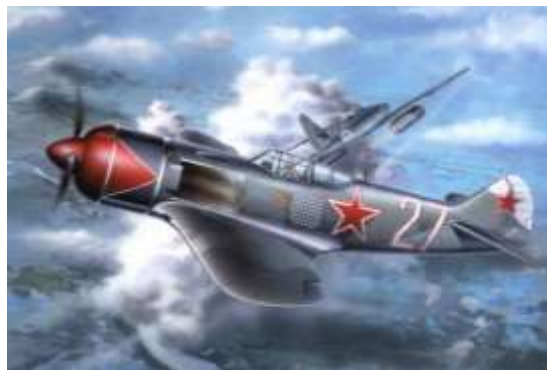
Рисунок 3 – Ла-7

Истребитель Ил-2, машина конструкции Сергея Ильюшина, стал первым в мире самолётом, получившим столь мощное бронирование. Благодаря толстой капсуле кабины самолёт был почти неуязвим для пулемётов и винтовочных выстрелов с земли (рис. 4).