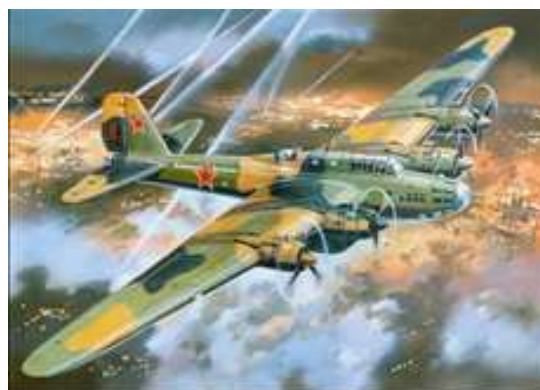
Рисунок 6 – РТБ-7 (Пе-8)