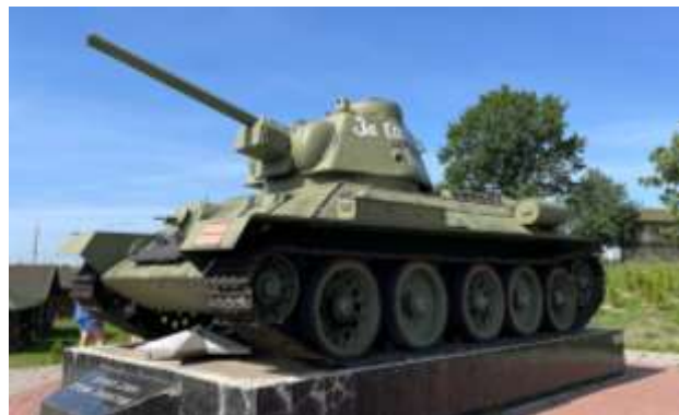
Рисунок 7 – Т-34 с пушкой Ф-34

КВ был вооружён 76-мм пушкой, способной пробивать лобовую броню любого