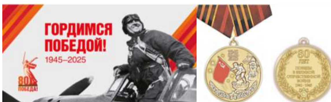
Рисунок 1 – Плакат и медаль к 80-летию Победы в Великой Отечественной войне

На заседании Государственного Совета В. В. Путин 20 декабря 2024 г. озвучил инициативу: «Предлагаю объявить 2025 год Годом защитника Отечества, в честь наших героев и участников специальной военной операции, а также в память о подвигах всех предков, сражавшихся за Родину. Во славу отцов, дедов, прадедов – победителей над нацизмом».